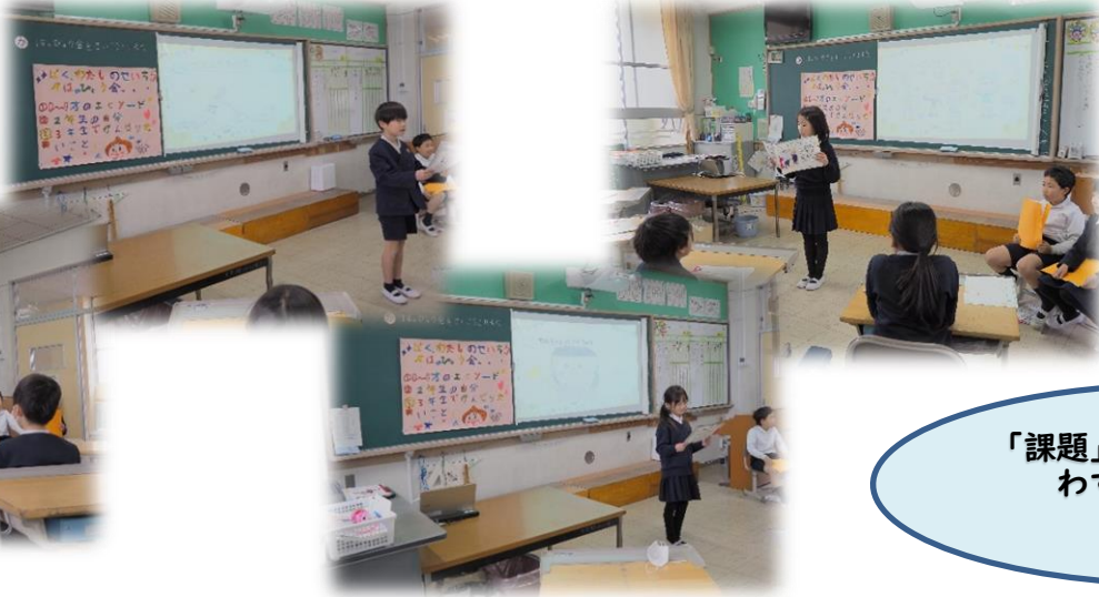
<子どもたちの日記>

また、3年生で頑張りたいことの中には「次に入学してくる新一年生のお手本になれる人になる」や「あじさいの世話を頑張りたい」など、来年の自分を想像して考えている児童もいました。発表の際には緊張している様子も見られましたが、最後までやり切ろうとする姿が伝わってきた発表会になりました。ご参観くださりありがとうございました。