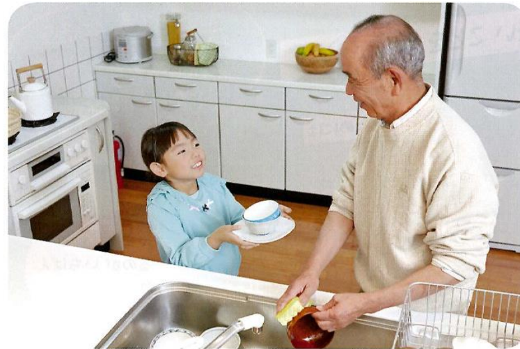
●しょくじの あとかたづけ