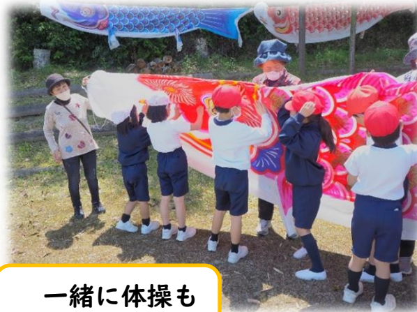
一緒に体操もしました！