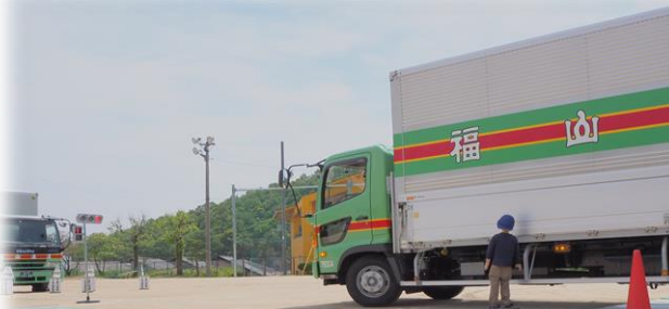
トラックに乗せてもらいました！