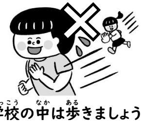
学校の中は歩きましょう

新学期が始まってほぼ1か月がたち、新しい生活に慣れてきたころだとも思います。慣れてくるとケガをしやすくなったりします。休けい時間には早く外に出たい気持ちがあつて、廊下を走ってしまいがちですが、けがのもとです。落ちついて行動しましょうね。