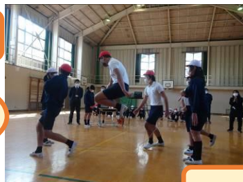
6年 圧巻のパフォーマンスでした!!