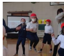
1年生 初めての縄跳び大会!

2月18日(金)に、校内縄とび大会を行いました。1月から本格的に練習を始めましたが、引っかかる回数も多く、なかなか記録を伸ばすことができませんでした。しかし、大会が近づくにつれ、各学年の練習に気合が入り、本番ではすべての学年で記録を更新することができました。1つの行事に向かって力を合わせると、子ども達はこんなにも成長するのだなと実感しました。これからも、行事をとおして子どもたちの力を高めていきたいと思ひます。